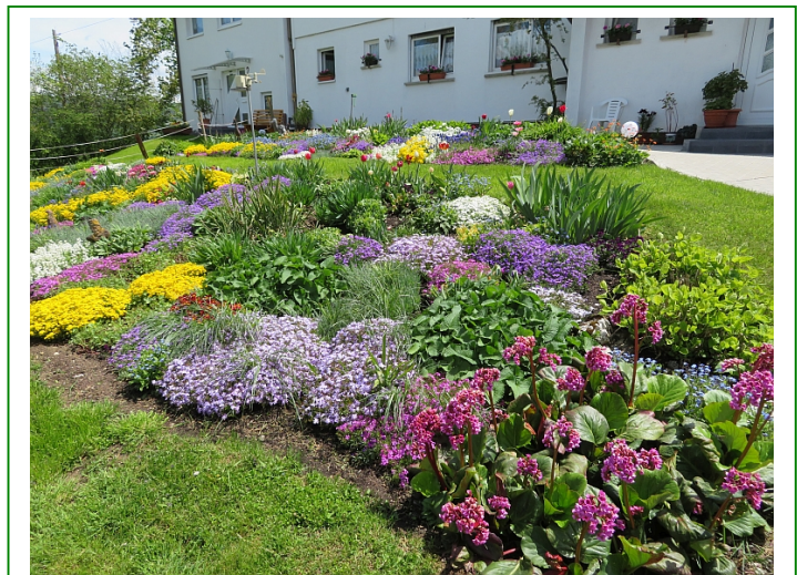
... und eine weitere.

Wichtig ist, dass unsere Gärten vom Frühjahr bis zum Herbst etwas Blühendes für die Insekten und Samen sowie Früchte für die Vögel und Kleinsäuger anbieten.