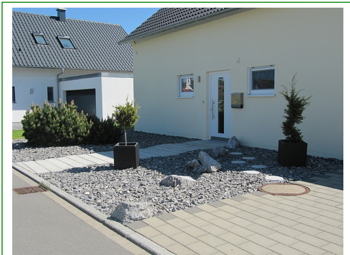
Eine Möglichkeit, den Garten zu gestalten ...

Immer wieder erlebe ich bei den Rosenberatungen, dass sich Rosenliebhaber/innen fast dafür entschuldigen, dass sie die dicht gefüllten, edel geformten Rosen lieben und sie bevorzugt in ihren Gärten pflanzen, wohlwissend, dass diese Rosen für die Insekten nur geringen oder gar keinen Pollen und Nektar bereit halten. Jedoch soll und darf jeder in seinen Garten pflanzen, was ihm Freude bereitet und gefällt, ich möchte schon fast sagen: "Hauptsache es wird überhaupt etwas gepflanzt."