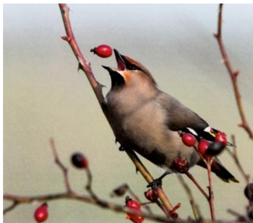
Auch der Seidenschwanz liebt Hagebutten