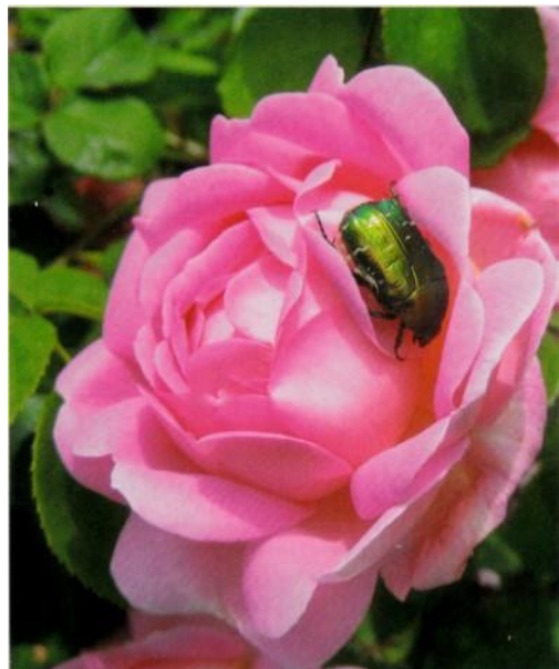
Bronzegrüner Rosenkäfer ( Protaetia lugubris ) auf ‚Centenaire de Lourdes‘

Diese Aussage ist so nicht richtig und muss unbedingt korrigiert werden!“